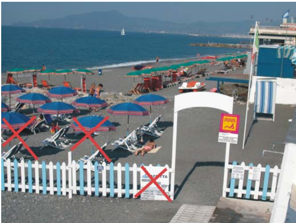
Tavola 3 ESEMPI DI POSIZIONAMENTO DEL CARTELLO